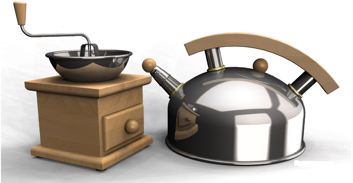
Tegnet med TurboCAD